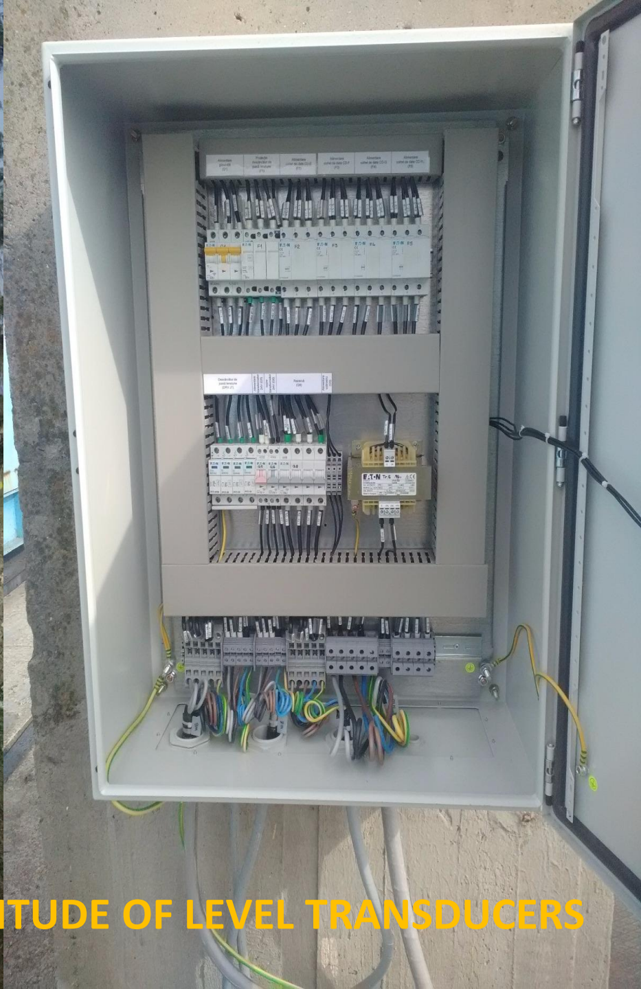
DAM EQUIPPED WITH A MULTITUDE OF LEVEL TRANSDUCERS