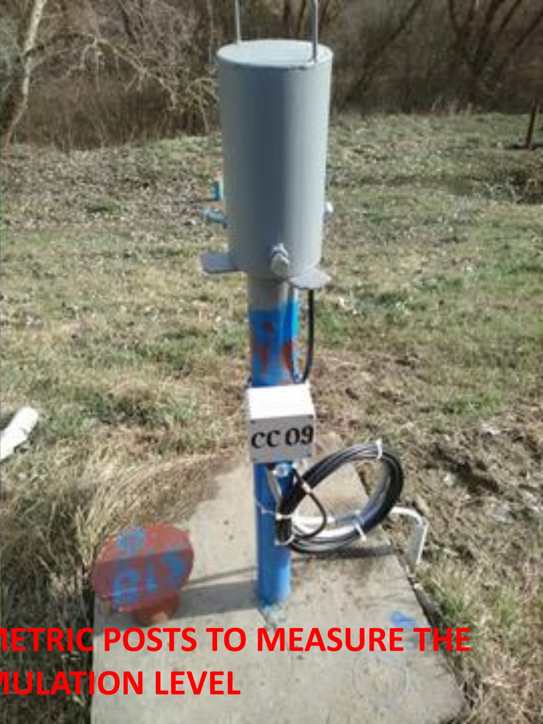
AUTOMATED HYDROMETRIC POSTS TO MEASURE THE ACCUMULATION LEVEL